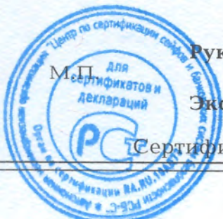
Схема сертификации - 1с